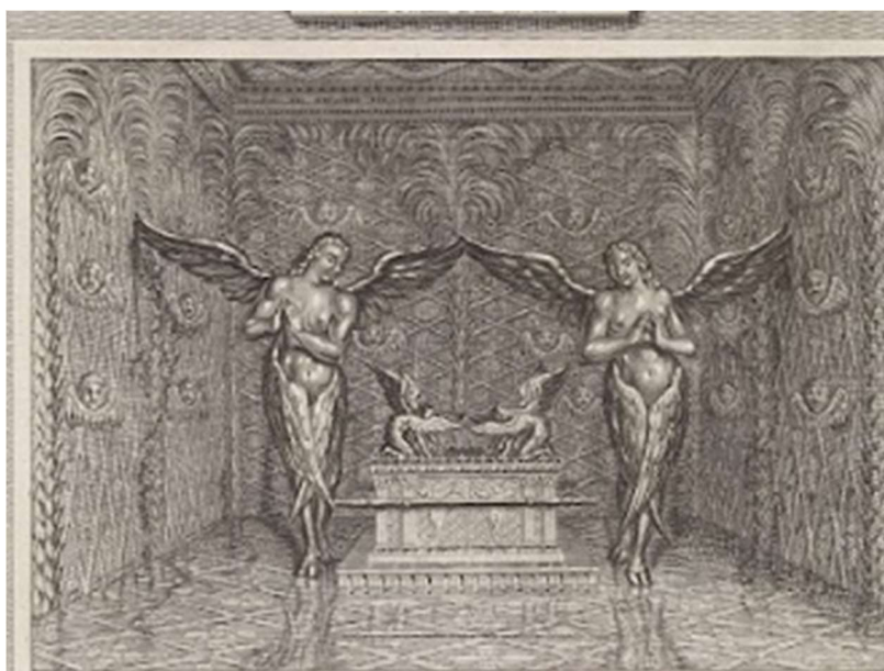
De ark van het verbond van Jan Luyken naar Ottmar Elliger 1700