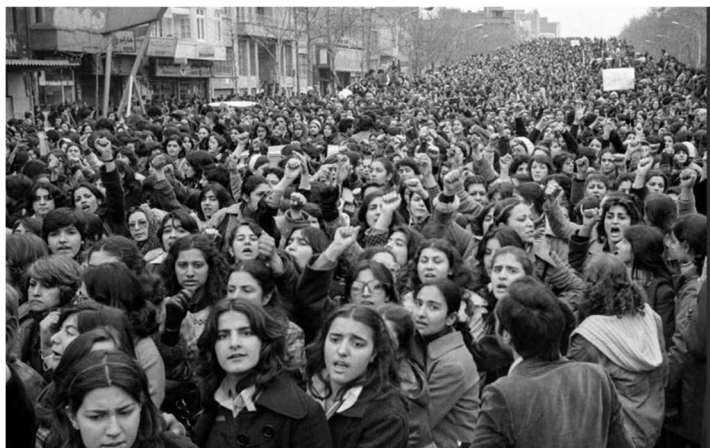
Iraanse vrouwen protesteren tegen de hijab wetten en vragen om gelijke rechten

Op donderdagavond 7 maart van 19.30-21.00 uur in de Bibliotheek Purmerend een lezing door de Kunstmeisjes in samenwerking met Discriminatiezaken.nl over het boek: "Meer dan Muze". Toegang gratis.