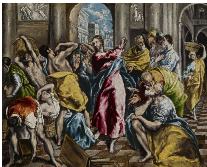
El Greco, Christus jaagt de handelaren de tempel uit, 1571-1576